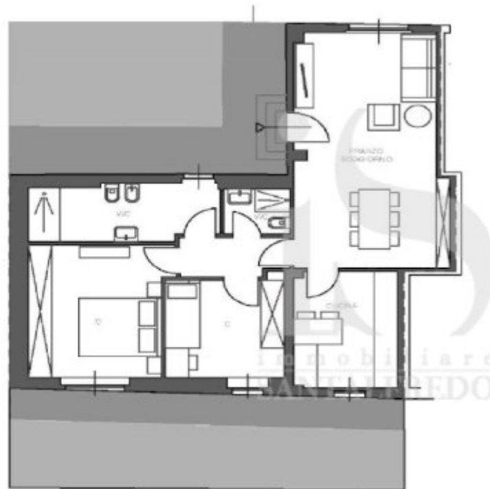
Pianta Piano Terra - A11