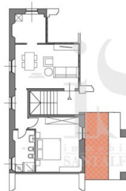
Pianta Piano Primo - A05